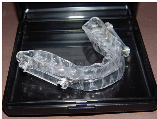
Fig. 1: The OPM 4 J. Fig. 1 : OPM4 J.

La pose a été réalisée après examen clinique et radiologique de la dentition par l'orthodontiste, permettant de vérifier sa capacité à supporter la force de propulsion ainsi que l'état des ATM et du parodonte. L'édentation complète mandibulaire